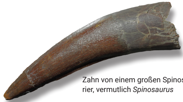
Zahn von einem großen Spinosaurier, vermutlich Spinosaurus

etwas übertraf. Die Reste des Spinosaurus waren eines der spektakulärsten Schaustücke des Paläontologischen Museum Münchens, bis sie 1944 einem alliierten Bombenangriff zum Opfer fielen.