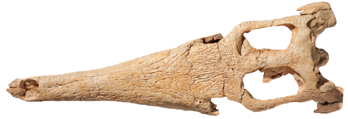
Schädel von Chenanisuchus lateroculi aus dem Paläozän von Marokko in dorsaler Ansicht

Die Krokodile sind eine wichtige Großgruppe der Reptilien. Zusammen mit den Dinosauriern, Flugsauriern und den Vögeln gehören sie zur Großgruppe der Archosaurier („herrschende Reptilien“). Die Entwicklungslinien, die zum Einen zu den heutigen Krokodilen und zum Anderen (über die Dinosaurier) zu den Vögeln führen, trennten sich in der Trias, vor etwa 240 Millionen Jahren. Obwohl wir heute bei dem Wort „Krokodil“ an die uns vertrauten semiaquatischen Lauerjäger denken, hat diese Gruppe im Laufe ihrer langen Geschichte viele verschiedene Anpassungstypen hervorgebracht und zahlreiche ökologische Nischen besetzt. Die allermeisten der heutigen Krokodile leben in Seen und Flüssen, nur das australische Leistenkrokodil, eine der größten heutigen Arten, ist auch in der Lage, größere Distanzen im Salzwasser der Meere zu überqueren. Im Erdmittelalter gab es jedoch verschiedene Gruppen von Krokodilen, die an das Leben im Meer angepasst waren. Unter diesen repräsentieren die Dyrosauriden, zu denen Chenanisuchus gehört, die letzten strikt marinen Krokodile. Die Ursprünge der Gruppe sind vermutlich in der unteren Oberkreide in Afrika zu finden, wo auch ihre nächsten Verwandten, die gigantischen Pholidosauriden (zu denen unter anderem die bis zu 10 m lange Gattung Sarcosuchus gehört), vorkommen. Nachdem die Dyrosauriden das Meer als Lebensraum erobert hatten, haben sie sich offenbar schnell verbreitet; gegen Ende der Kreidezeit findet man