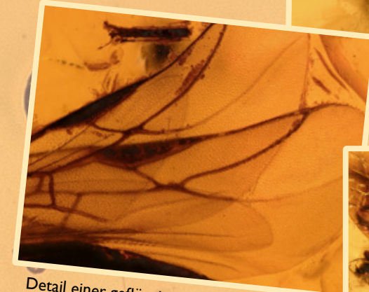
Detail einer geflügelten Ross-Ameise Detail of a winged carpenter ant