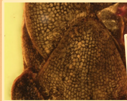
Schuppenartige Koniferen-Blätter Scale-like conifer leaves

Begleitend zur Ausstellung ist eine Broschüre mit einer Vielzahl fotografischer Aufnahmen erhältlich.