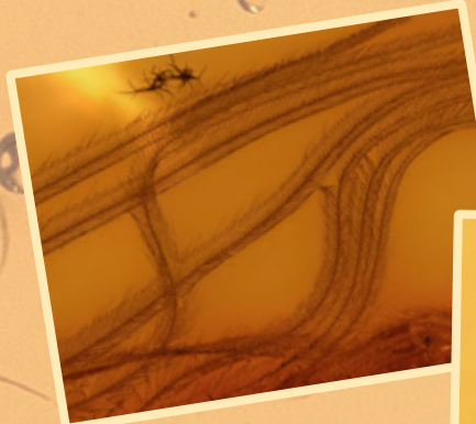
Vogel-Feder Bird feather