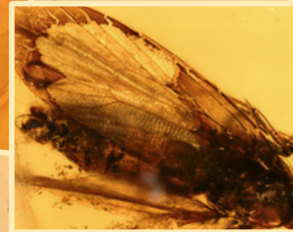
Faulholz-Motte Concealer moth