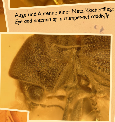
Auge und Antenne einer Netz-Köcherfliege Eye and antenna of a trumpet-net caddisfly