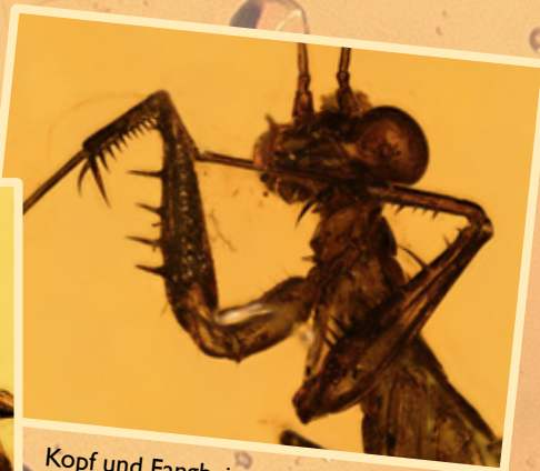
Kopf und Fangbeine einer Gottesanbeterin Head and first legs of a praying mantis