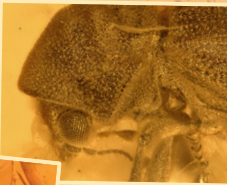
Kopf eines Nagekäfers Head of a wood-boring beetle