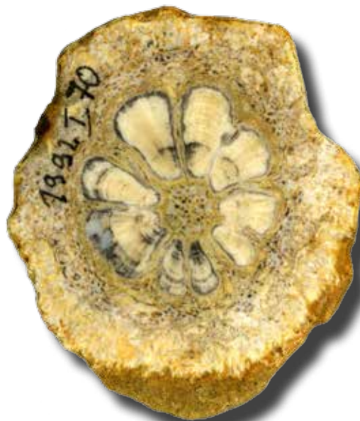
Hermanophyton kirkbyorum , Stämmchen im Querschnitt.

Ausschnitt aus einem Holz-Segment. Man erkennt die regelmäßig angeordneten Zellen des Holzes sowie mehrere dünne Holzstrahlen als dunkle Linien.