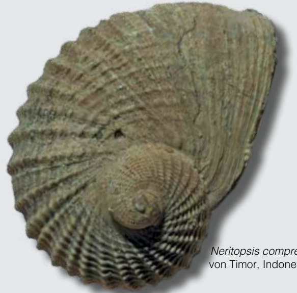
Neritopsis compressa von Timor, Indonesien

den obertriassischen Kalken der Alpen und Timor treten oft dieselben oder ähnliche Arten auf, wie es auch bei unserer Schnecke der Fall ist. Dies ist erstaunlich, da beide Regionen auch damals über 10.000 km voneinander entfernt lagen. Die Ähnlichkeit der Tierwelt hängt mit der damaligen geographischen Situation zusammen. In der Trias waren fast alle Kontinente im Superkontinent Pangäa vereint. In diesen Superkontinent griff von Osten her ein großer Ost-West verlaufender Ozean ein: die Tethys. Timor und die Alpen lagen etwa auf dem selben Breitengrad, wenn auch weit voneinander entfernt. Auch die Umweltbedingungen waren während der oberen Trias in Timor und Österreich ähnlich. Beide Gebiete lagen in den Tropen, wo die fossilführenden Kalke küstenfern und wahrscheinlich in beträchtlicher Wassertiefe abgelagert wurden. Solche Kalke treten in den Alpen, Timor und anderen Regionen der ehemaligen Tethys auf; sie werden nach dem Vorkommen im Salzburger Land als Hallstätter Blöcke oder Hallstätter Kalke bezeichnet. Es sind fossilreiche, helle oder rote bis rosafarbene Kalke, in denen Ammoniten – ausgestorbene Verwandte unserer heutigen Tintenfische – besonders häufig sind. Ammoniten konnten frei im Ozean schwimmen. Schnecken sind in den Hallstätter Kalken seltener. Sie lebten im Gegensatz zu den Ammoniten kriechend am Meeresboden.